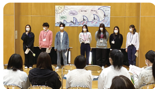
(新入生ガイダンス)