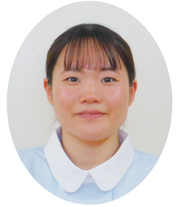
1年 (25期生) Oさん

看護学生は専門的な知識や技術を沢山覚えなくてはならなくて大変ですが、クラスメイトとわからないことを教え合い、協力しながら日々頑張っています。ぜひ本校と一緒に看護師を目指しましょう！