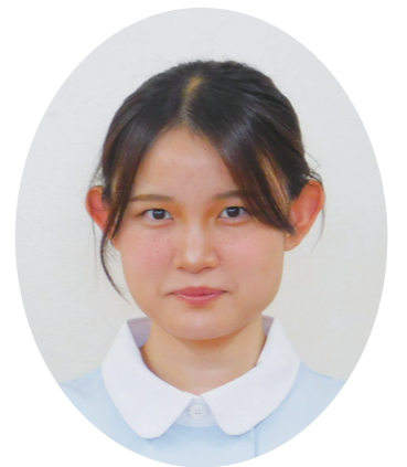
3年 (23期生) Oさん

ぜひこの素敵な環境で、知識や技術、人とかかわる心を学び、一緒に看護師を目指しませんか？